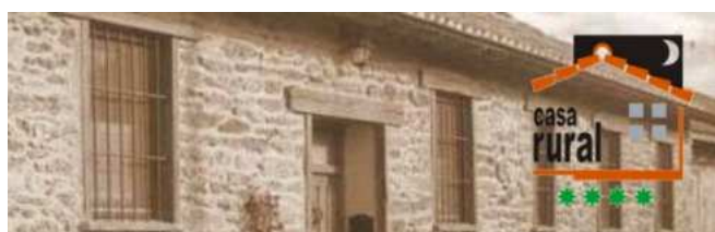
Casa de la Parrada. Casa Rural en Peque (Zamora) casadelaparrada.blogspot.com.es